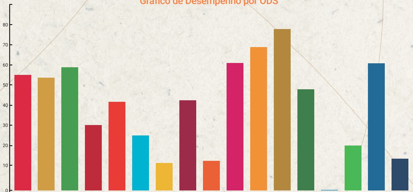
Gráfico de Desempenho por ODS